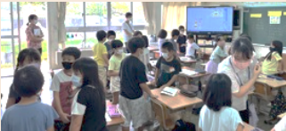
グループでの話し合い

9月20日(火)に2年生道徳「きいろいベンチ」の授業がありました。みんなが使う物を大切に、約束やまわりを守ることの大切さについて、お友達と話し合っていましたよ。