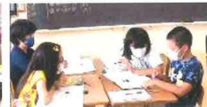
【グループでの話し合い】