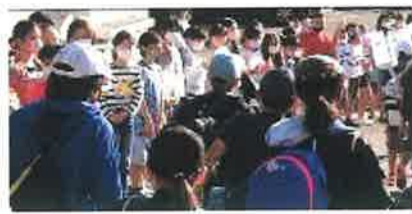
【正門までの見送り】