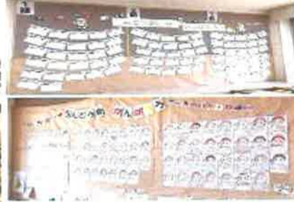
【大運動会のめあて 1、2年】