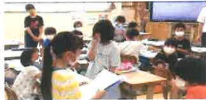
【自分の考えを発表している様子】