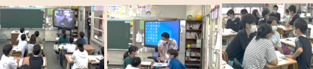
ビデオ視聴の様子 教師の支援 話し合いの様子

11月10日(木)、6年国語「世界に目を向けて意見文を書こう」の学習がありました。カカオ農園で働く子ども(児童労働)の様子をビデオで視聴し、友達と意見を交流しました。説得力のある意見文が書けるといいですね。