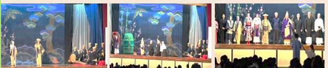
かぎやで風 執心鐘入 出演者の皆さん

11月16日(水)の「組踊鑑賞会4年、5年」では、執心鐘入の鑑賞を実施しました。また、11月17日(木)には、「阿嘉小学校との交流会」が3年ぶりに実施されました。その様子をご覧ください。