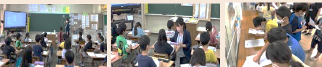
授業の様子 教師の支援 児童の交流

11月9日(水)に2年国語「同じところ、ちがうところ」の学習がありました。「りんごとなし」「ぶどうとマスカット」などの2つの物を色、形、大きさ、食べ方等について比べ、文章に表す学習内容でした。授業後に全教員で研修会を実施し、授業改善について話し合いました。