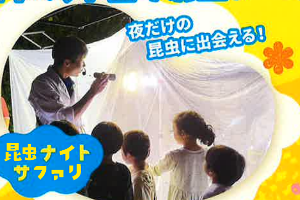
夜だけの 昆虫に出会える!